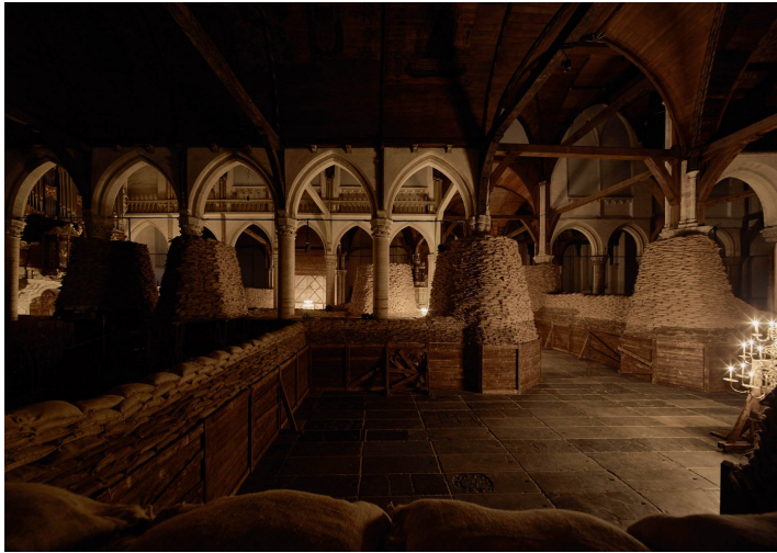
Expositie Poems for Earthlings van Adrián Villar Rojas in de Oude Kerk in Amsterdam, 2019